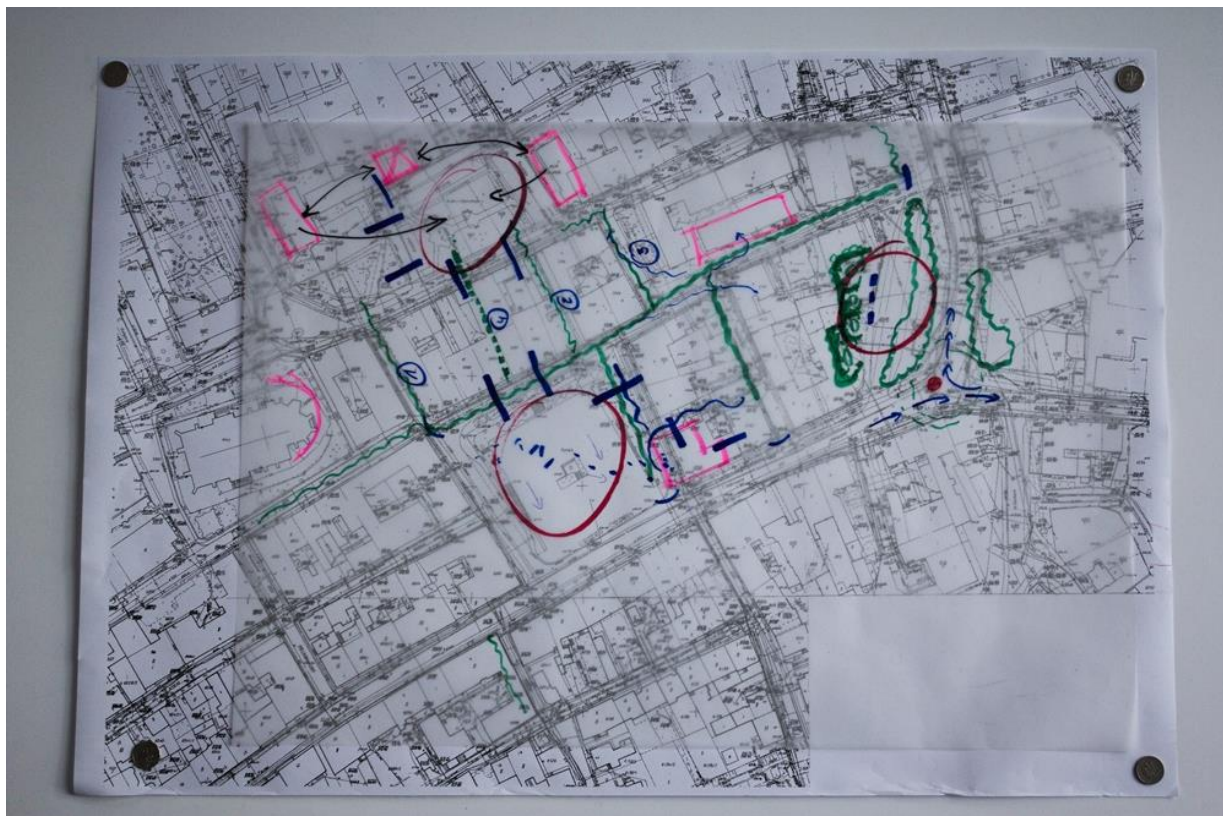
Fot. 3 Mapa robocza Grupy