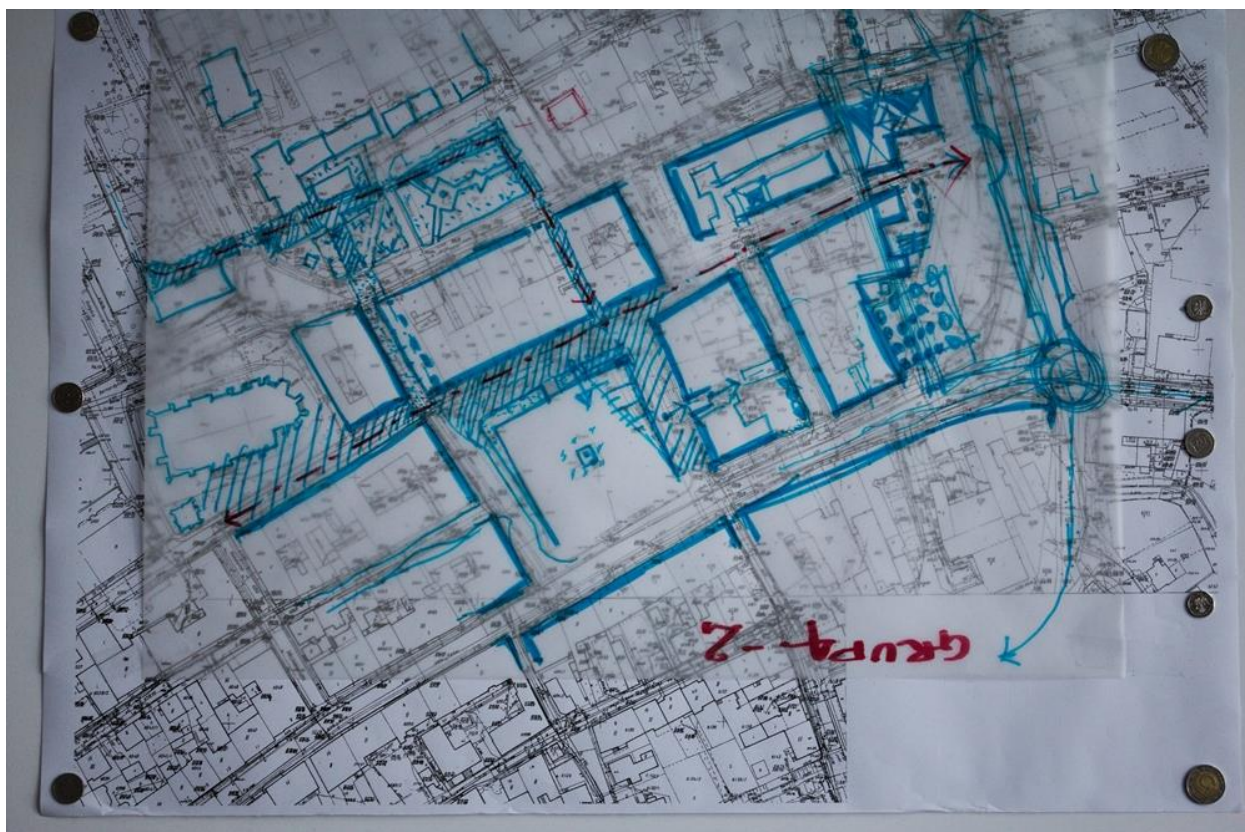
Fot. 2 Mapa robocza Grupy